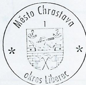
Zita V á c l a v í k o v á místostarostka