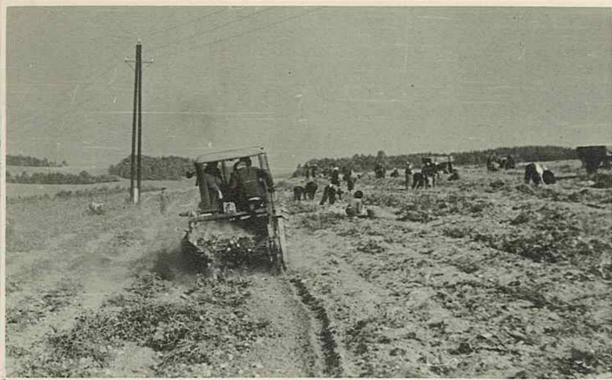
Na žakovských brigádách při vybírání brambor