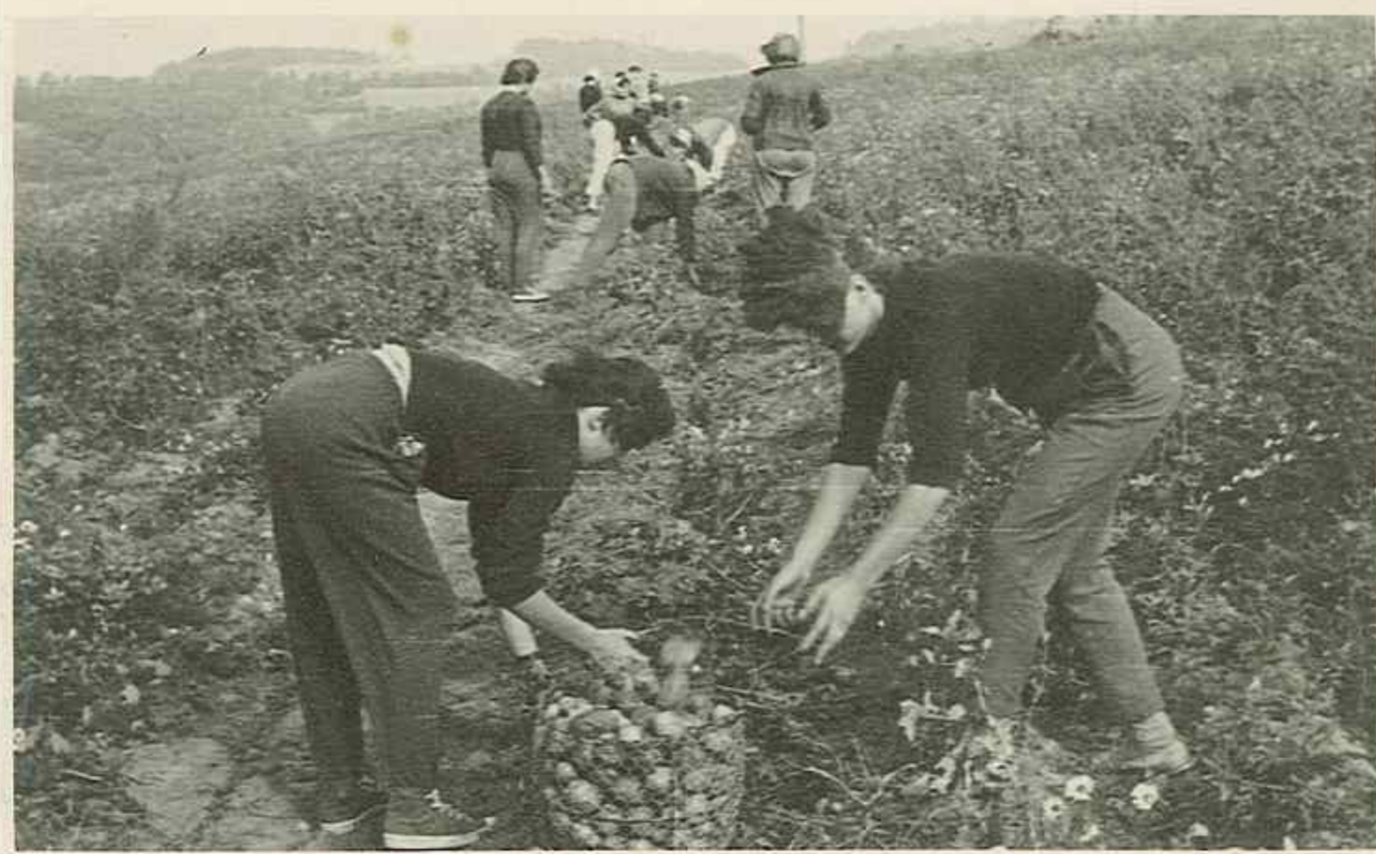
Dívky ze III. tř. SVVŠ →