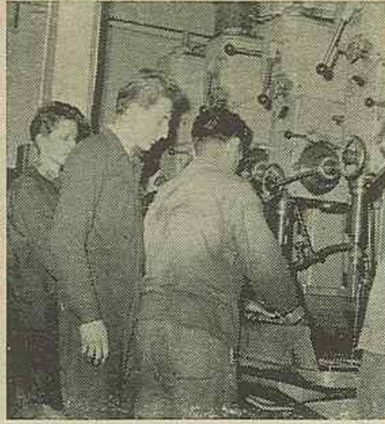
Studenti z SVVŠ z Chrastavy při polytechnické výchově.