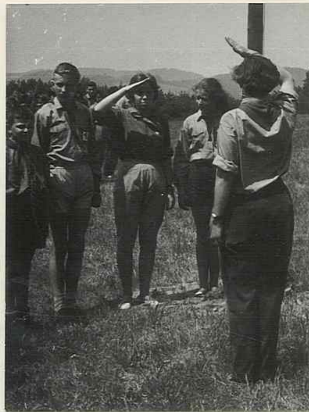
Ze okres. srazu mladých turistů v Českém Dubu 21.-24. VI. 1962