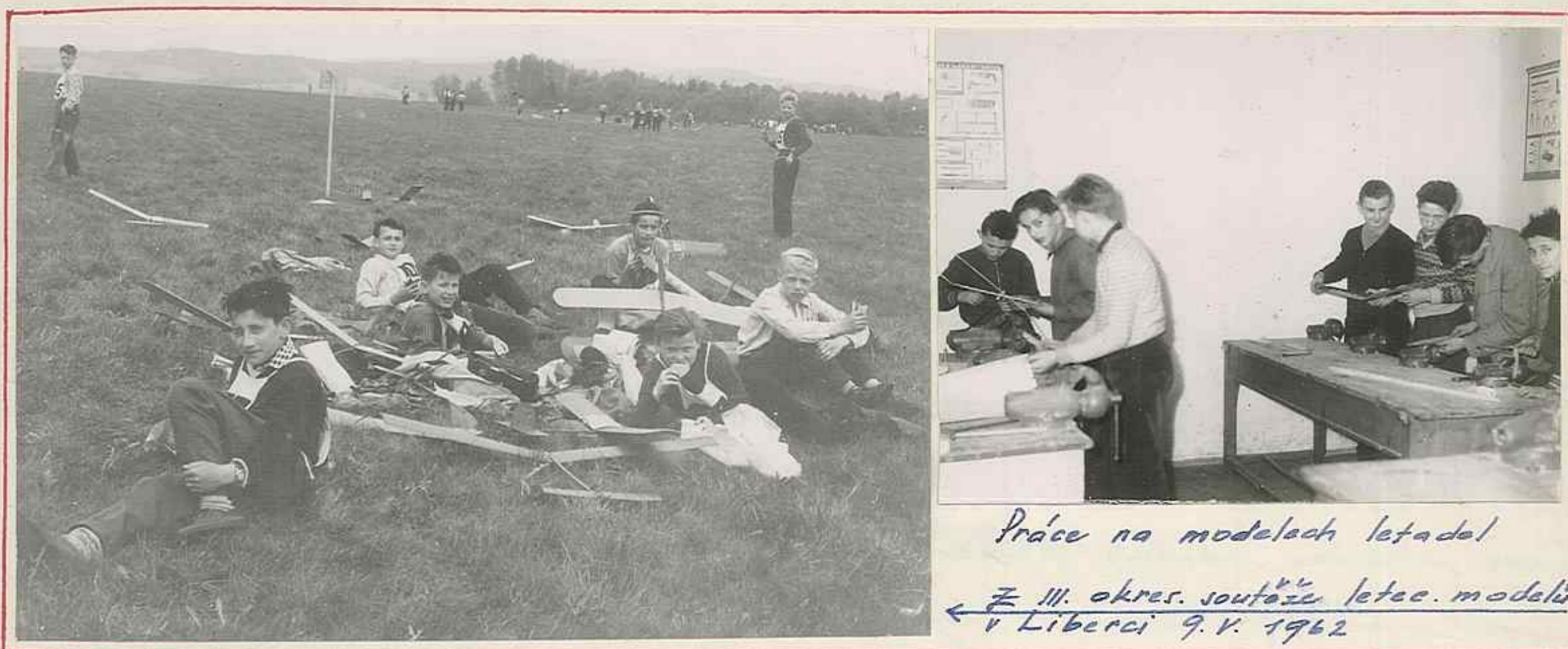
Práce na modelech letadel

i okresní soutěži 9. V. 1962 na letišti v Liberci. Zde velmi úspěšně obsadil 1. místo a dalších 6 ráků se umístilo mezi prvními 20 x 94 účastníků soutěže.