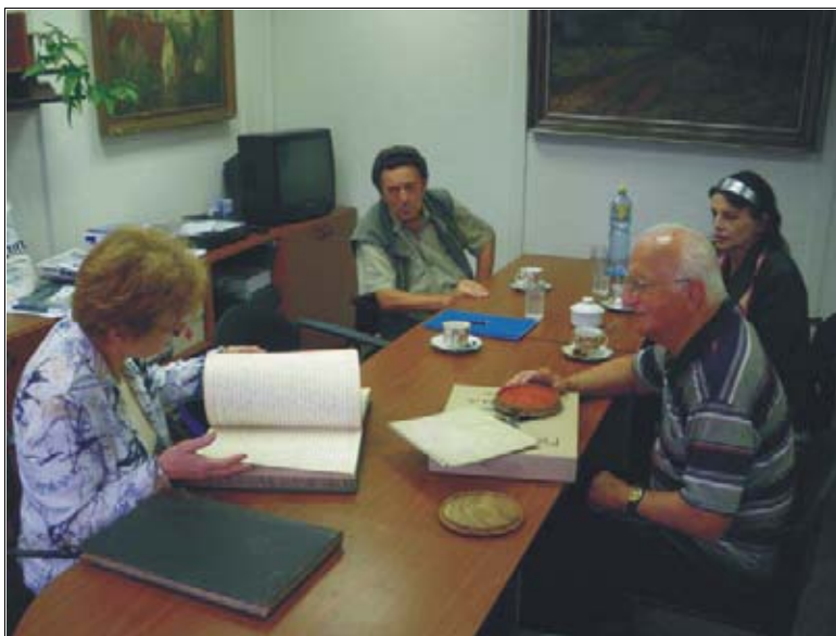
Rada SPHMCH v Okresním archivu v Liberci.