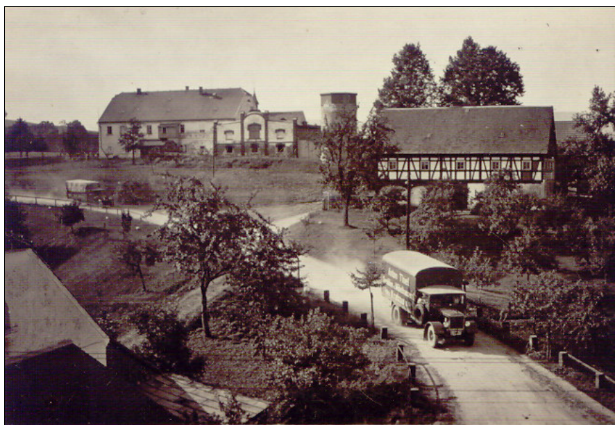
Statek ve Václavicích (čp. 21) na křižovatce na Pekařku se stal ředitelstvím JZD a později střediskem hospodářství Státního statku v Hrádku nad Nisou. Ilustrační dobová pohlednice pochází z roku 1930.

Protože velká část JZD živořila, byly založeny tzv.