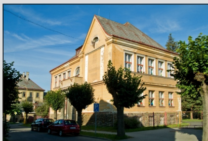
Před generální rekonstrukcí - podzim 2012