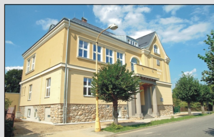
Zrekonstruovaná školka - 8/ 2013

Město Chrastava vás srdečně zve na slavnostní otevření zrekonstruované, původně České školy obecné z roku 1923, dnes mateřské školky v Revoluční ulici.