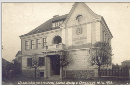
Nově postavená Česká obecná škola - 1923