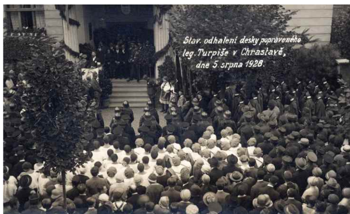
Slav. odhalení desky popraveného leg. Turpiše v Chrastavě, dne 5. srpna 1928.

Přijměte pozvání na slavnostní akt uctění památky chrastavského legionáře Františka Turpiše. 18. června 2018 v 15 hodin před školou na náměstí 1. máje.