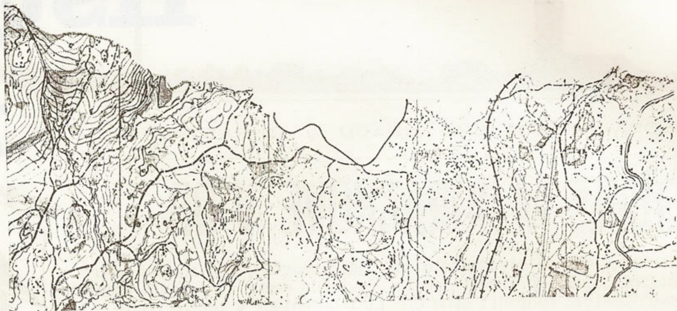
Ukázka mapy pro orientační běh

( Pro zajímavost : před několika dny skončilo mistrovství světa v orientačním běhu dospělých, které se po mnoha letech konalo právě u nás v oblasti Mariánských Lázní, Karlových Var a Nejdku. Zde naši sportovci zaznamenali velké úspěchy a vybojovali pro naše barvy i velké množství medailí. )