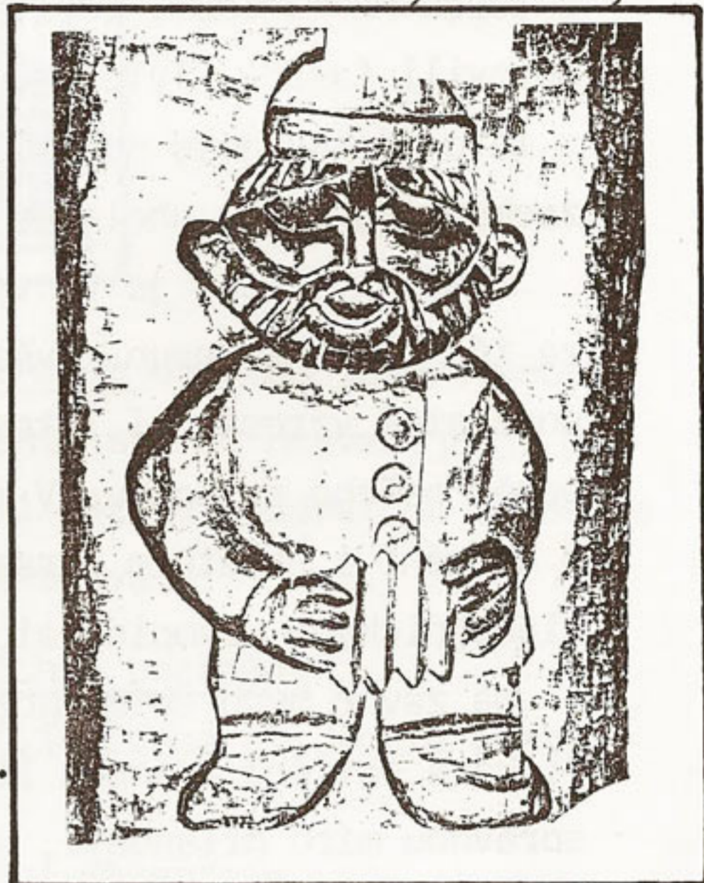
DUŽDA P. • Harmonikář •

Od roku 1984 jsme zcela přizpůsobili našim potřebám interiér budovy. Byla