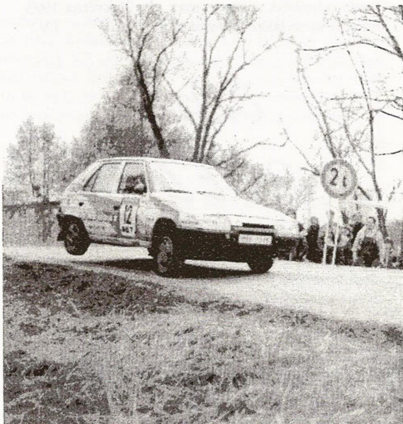
Posádka Raichl-Necadová s továrním Favoritem při skoku na RZ 7.

bý-Houdek (Š 1000 MB), N nad A300: Krončák-Rohla (BMW 1800 GTI).