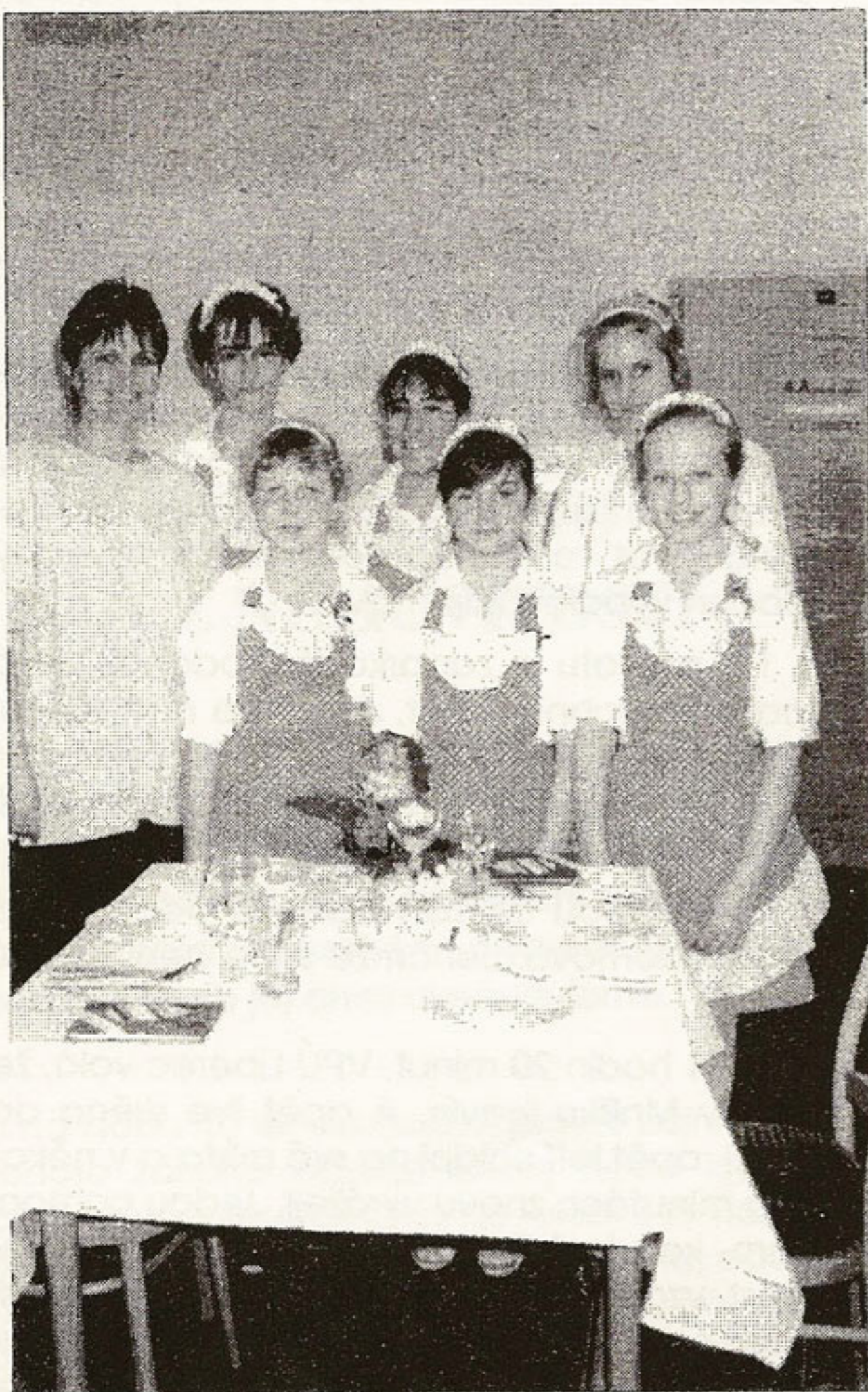
Chrastavské družstvo na soutěži dívčích klubů v roce 1992.

V první části soutěže děvčata předvedla svoje kuchařské umění jídlem nazvaným "králik po chrastavsku". Je třeba podotknout, že připravené jídlo sestavené z požadavků racionální výživy se povedlo ke spokojenosti děvčat i poroty.