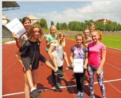
49. ročník Olympiády mládeže - ATLETIKA