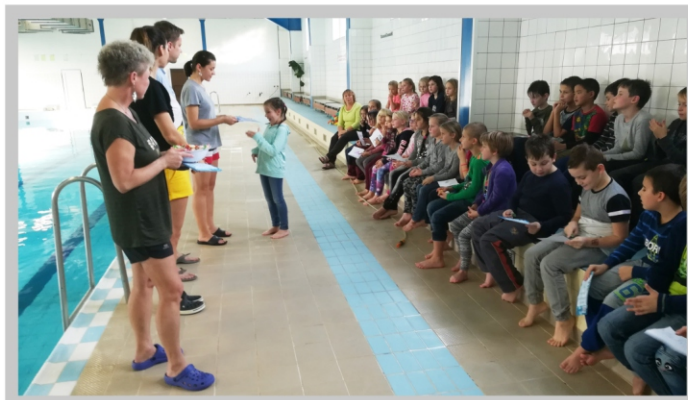
SPORTU ZDAR A PLAVÁNÍ ZVLÁŠŤ!

Plavecký výcvik zkrátka přinesl své ovoce a přejeme, aby tak tomu bylo i v dalších letech.